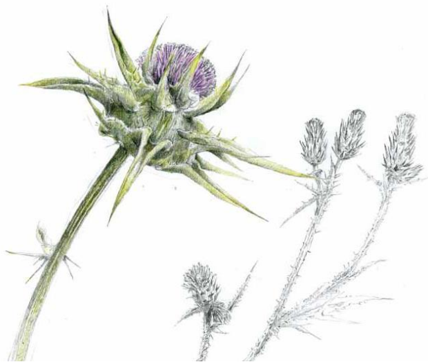
Silybum marianum et Cirsium arvense à Belgodère (Corse) - Rafaelian A (2012)

En vous espérant nombreux, à très bientôt sur les mailles Vigie-flore !